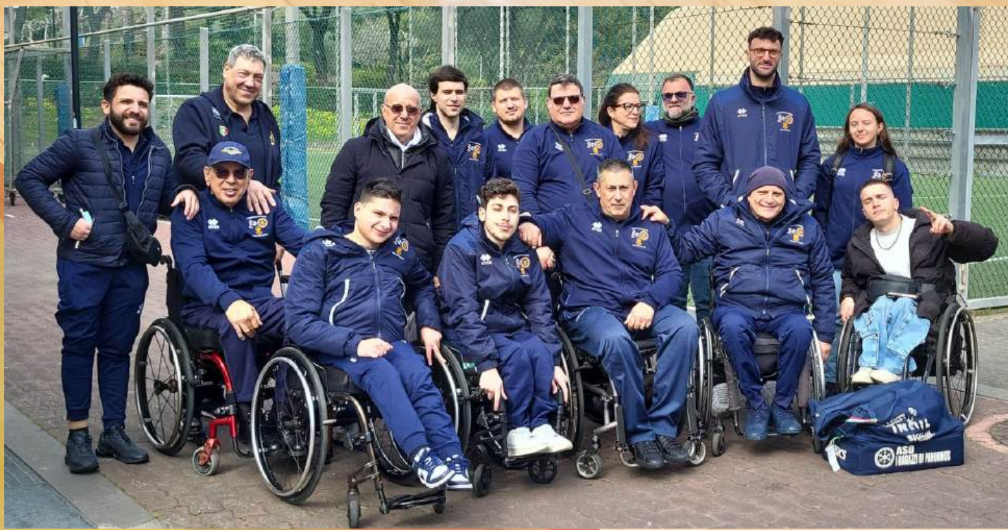
PARTITA DI BASKET IN CARROZZINA