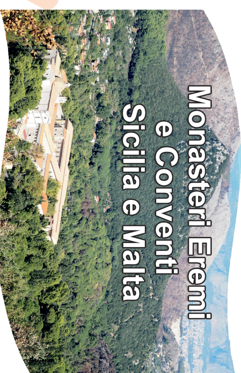
S.Martino delle scale

Monasteri Eremi e Conventi Sicilia e Malta