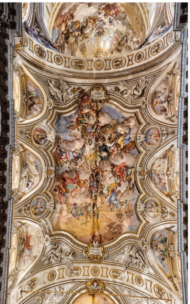
S. Caterina d'Alessandria

Nel corso degli anni ho personalmente fatto più volte l'esperienza del monastero, dell'eremo o del convento e, pensando bene, effettivamente essi hanno segnato indelebilmente la mia esperienza umana e spirituale.