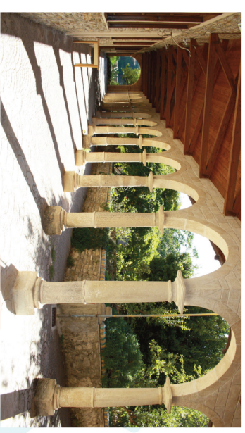
Chiostro SS. Salvatore

Governatore 2024-2025 Distretto 2110 R.I.