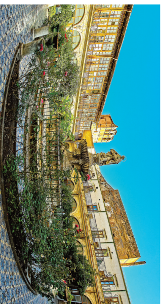
S. Caterina d'Alessandria

Questi luoghi sacri hanno caratterizzato il paesaggio unico di queste terre, contribuendo a definire la ricca ed unica tessitura della loro storia. Gli edifici di fede rappresentano un elemento chiave della tradizione religiosa siciliana e maltese. Entrambe queste terre sono state attraversate da diverse civiltà nel corso dei secoli, e ciascuna ha lasciato il proprio segno, attraverso l'impronta testimoniata dai vari stili architettonici.