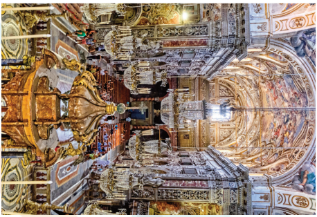
S. Caterina d'Alessandria

La scelta di dedicare la pubblicazione per l'anno rotariano, che va dal 1 Luglio 2024 al 30 Giugno 2025, in collaborazione con la storica Fondazione culturale Salvatore Sciascia del Distretto 2110 del Rotary International, ai Monasteri, agli Eremiti ed ai Conventi di Sicilia e Malta è legata a molteplici ragioni. Innanzitutto una pubblicazione con questi contenuti coniuga non solo valori artistici, storici e culturali, ma anche valori interiori e spirituali.