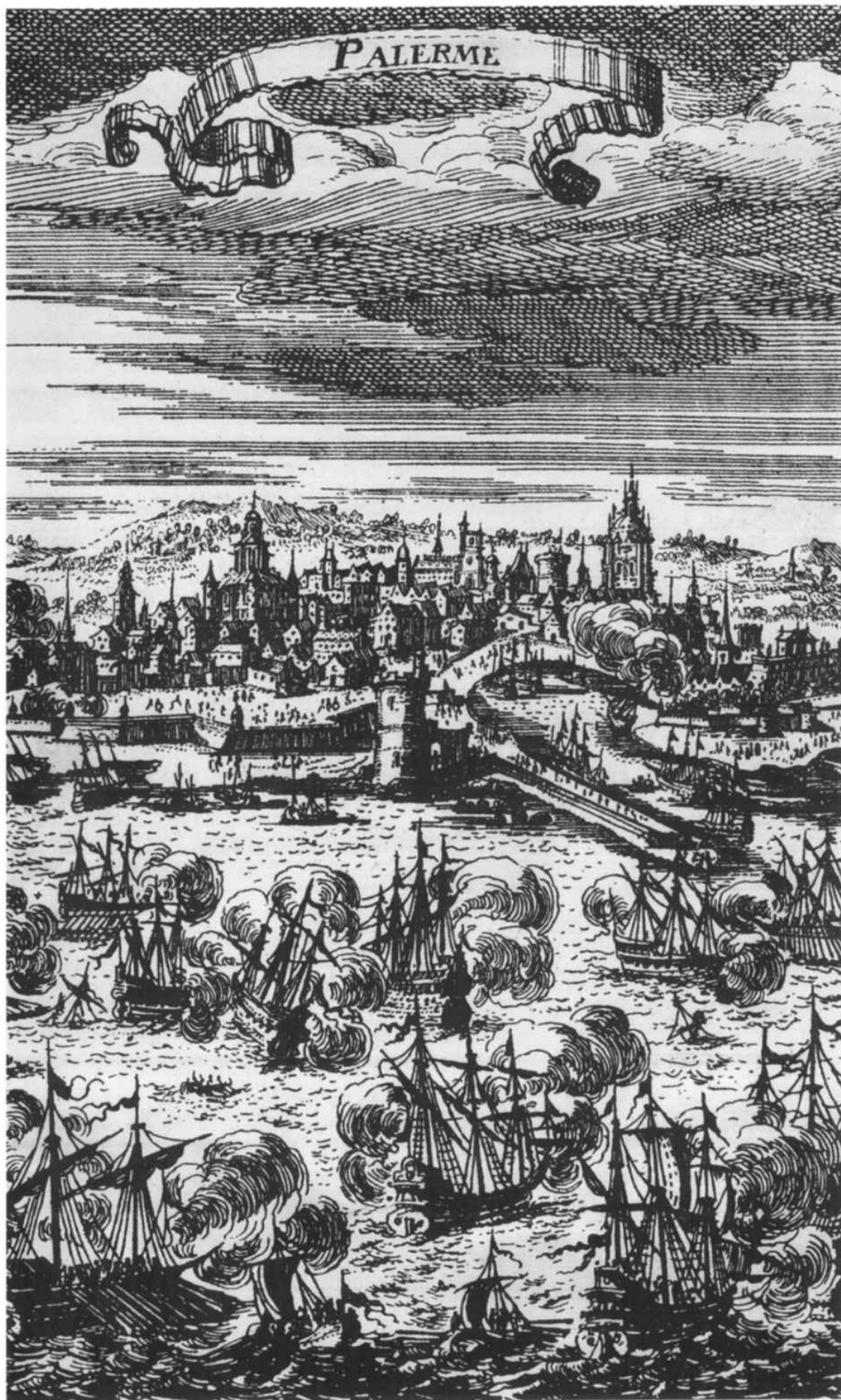
Una delle più antiche stampe di Palermo.