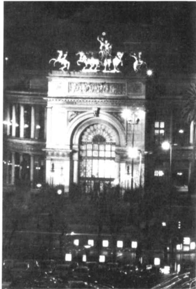
Palermo - Teatro "Politeama Garibaldi".

ANNO XXVI - Numero 6 NOVEMBRE - DICEMBRE 1996 ANNO XXVII - Numero 1 GENNAIO - FEBBRAIO 1997