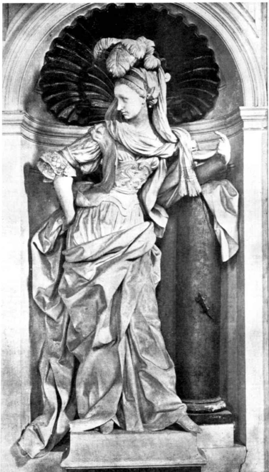
Giacomo Serpotta – Fortitudo - Oratorio del Rosario in S. Domenico (si noti sulla colonna la lucertola apposta come firma)