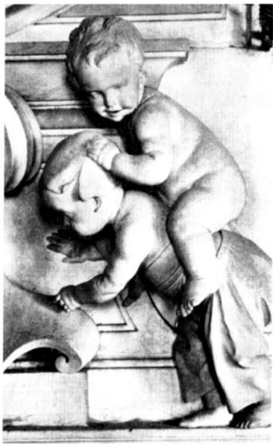
Giacomo Serpotta - Putti che giocano a cavalluccio - Oratorio del Rosario di S. Domenico