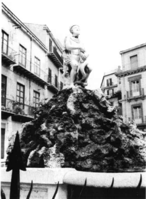
La Fontana del "Genio di Palermo" in piazza Rivoluzione