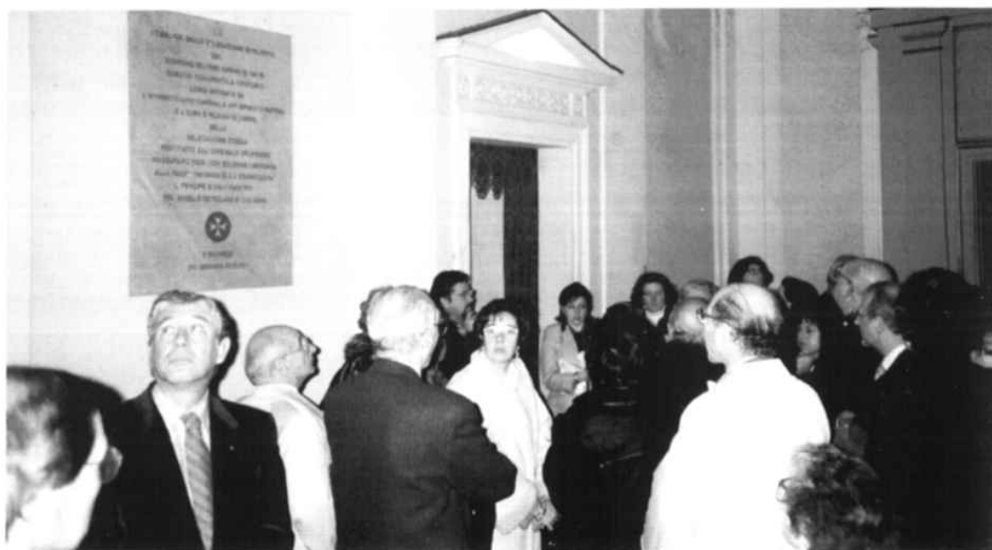
Busto del Serpotta Nel salone antistante l'Oratorio del SS. Rosario oggi sede dell'Ordine dei Cavalieri di Malta