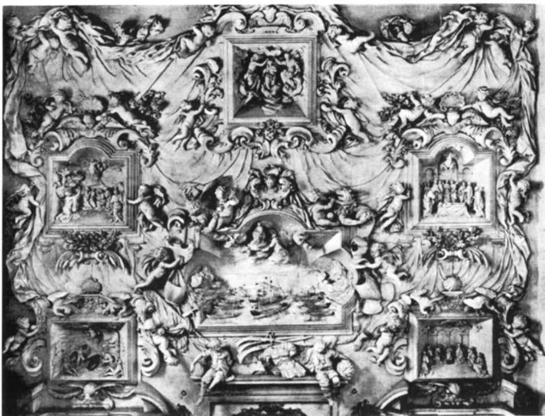
Giacomo Serpotta - Decorazione dell'Oratorio di S. Zita con la Battaglia di Lepanto ed i Misteri Gloriosi

scolasticamente ripetuti dai suoi continuatori per venire incontro al gusto e alla moda del tempo. La lunga stagione del barocco siciliano era sfociata quasi naturalmente nel decorativismo "rococò" dell'Europa pre-illuminista e fu proprio Giacomo Serpotta, in apparenza semplice decoratore e scultore, che, nobilitando un materiale "povero" come lo stucco, seppe sprovvincializzare l'estetica controriformistica perdurante e inserirsi nella nuova cultura senza negare quella magnificenza decorativa della tradizione barocca e precorrendo anche il neoclassicismo in certe soluzioni compositive dove la simmetria e l'addobbo ornamentale si fanno rispettosi dei volumi architettonici. I "teatrini" che rappresentano i misteri del Rosario a Santa Cita (Zita) o gli episodi della vita di San Lorenzo, nell'omonimo oratorio della Compagnia di San Francesco, sono infatti la summa di una poetica dove grazia e teatralità, arcadia e barocco, raggiungono un equilibrio e una essenzialità di rappresentazione che nella levigatezza e il luore astratto dei materiali suggerisce già la compostezza e la idealizzazione che saranno tipiche del neoclassicismo ove non si pensi anche ai modelli gagineschi da cui potrebbero derivare risalendo alla grande tribuna della Cattedrale e a ciò che di essa resta in loco dopo la dispersione e la distruzione operata dal progetto di Ferdinando Fuga alla fine del '700.