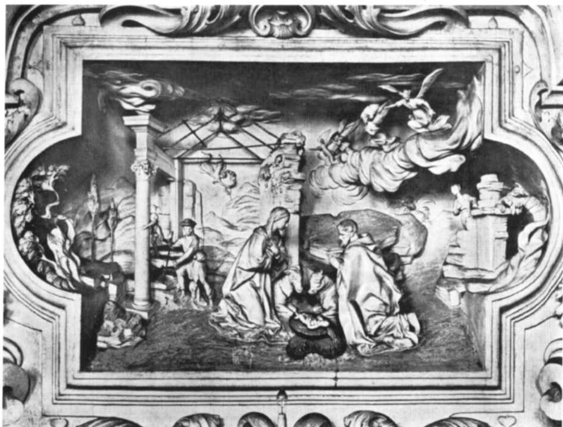
Giacomo Serpotta - Natività di Gesù. Oratorio di S. Zita