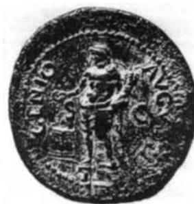
Moneta rappresentante il Genio dell'Imperatore

I "Geni" sono degli esseri immanenti sia a persone che a luoghi, città, paesi, territori, associazioni etc.. (Genius Loci) di cui simboleggiano l'essere spirituale.