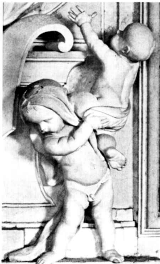
Giacomo Serpotta - Putti che si aiutano - Oratorio del Rosario di S. Domenico