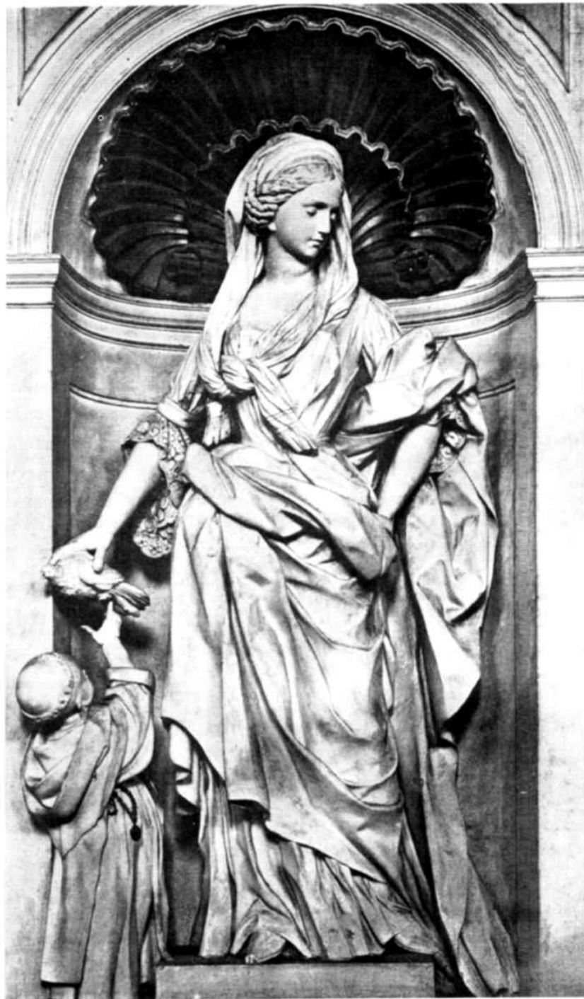
Giacomo Serpotta - Mansuetudo - Oratorio del Rosario in S. Domenico

Quel "serpottiano" che la distingue è un elemento personalissimo dato da una tecnica e da uno spirito di osservazione che non solo nobilita il povero impasto di colla, gesso, polvere di marmo e supporti lignei ma anima la mate-