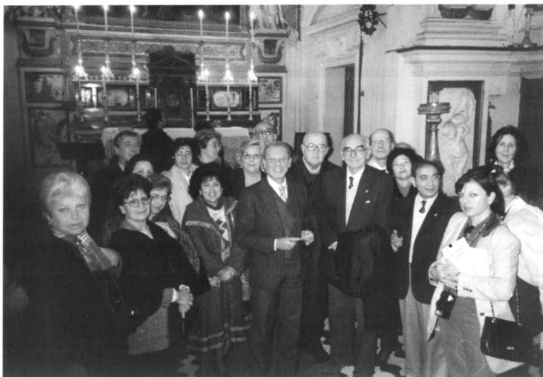
Davanti la Cappella della Madonna del Rosario