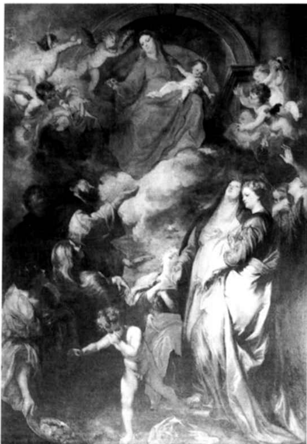
Anton Van Dyck - Madonna del Rosario - Palermo, Oratorio del Rosario in S. Domenico.

L'intervento di Giacomo Serpotta che tra la fine del '600 e la prima metà del '700 fu chiamato a decorare molti oratori di Compagnie e Confraternite,