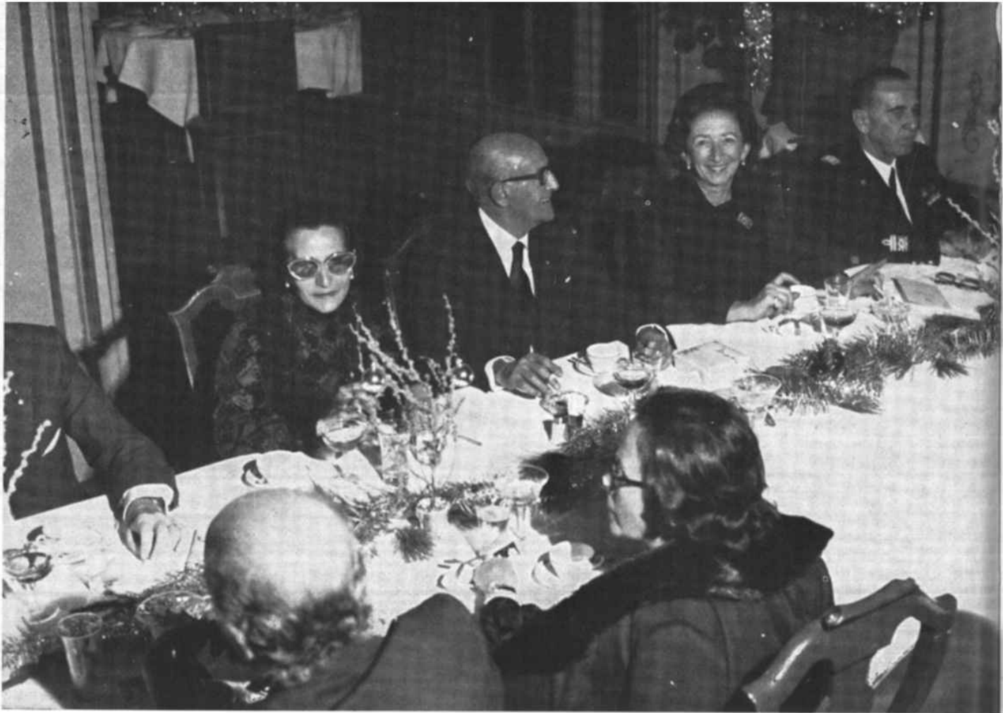
Il Presidente Marchese e altre autorità