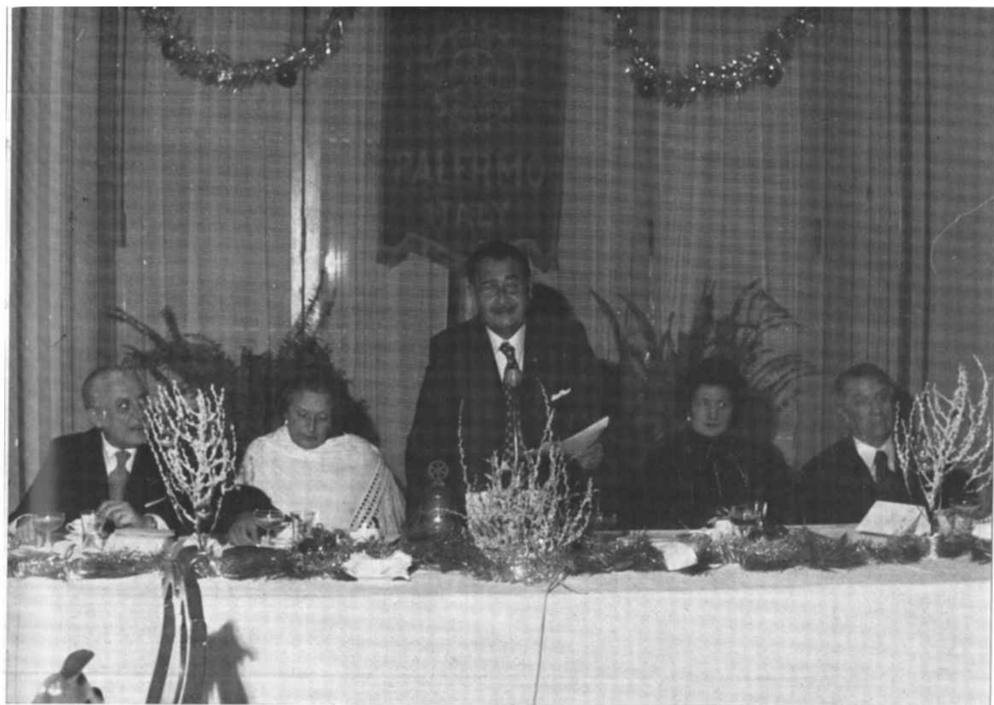
Il Presidente rivolge il suo indirizzo augurale