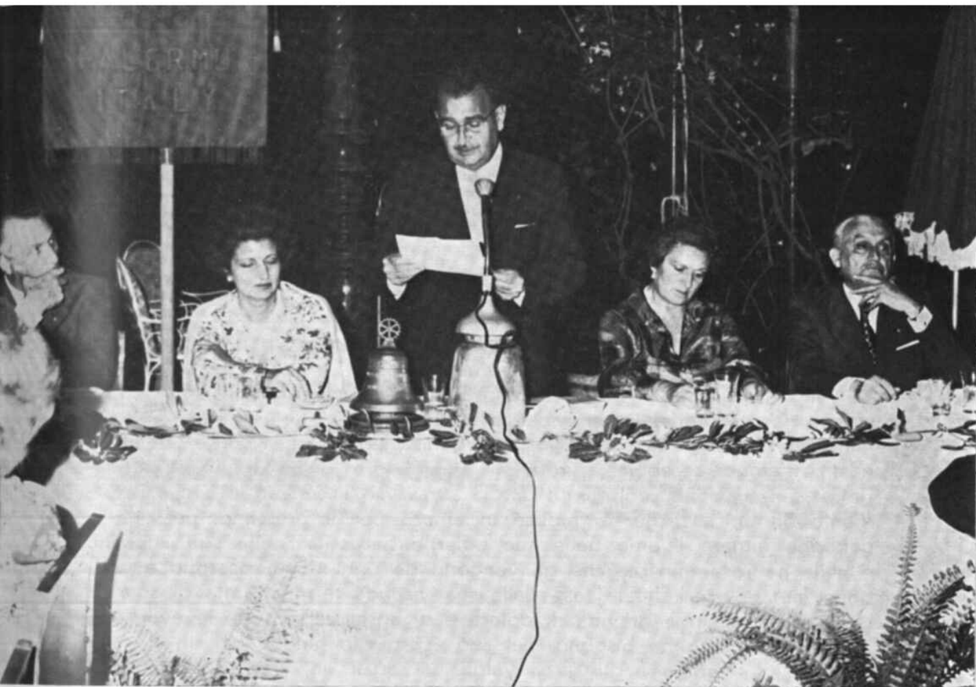
Il discorso programmatico del nuovo Presidente