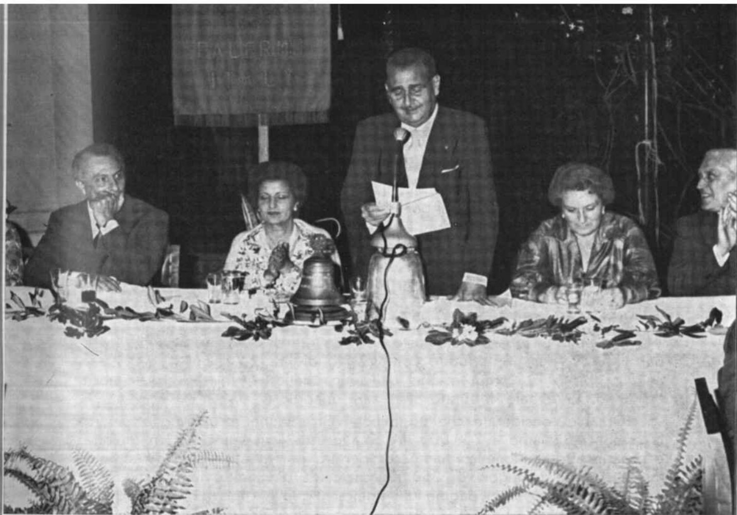
Il tavolo d'onore