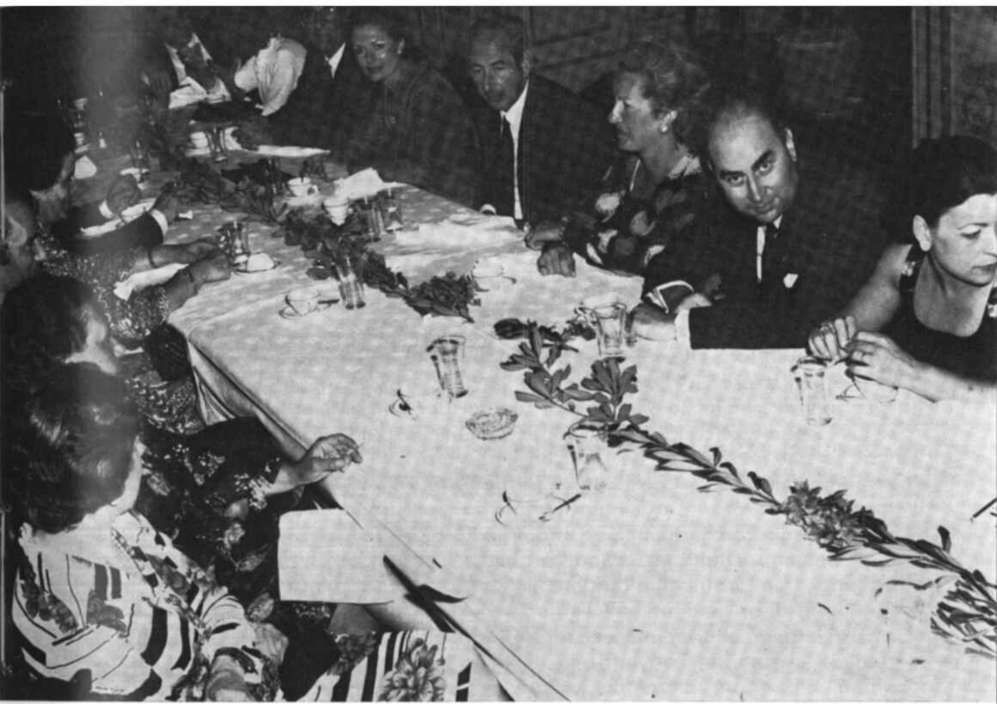
Uno scorcio della tavola