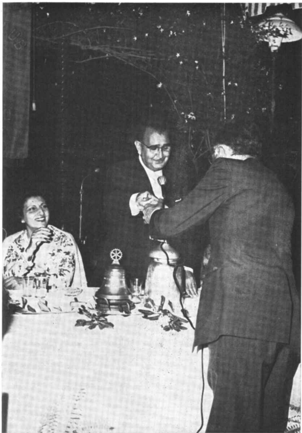
Scambio di bandierine