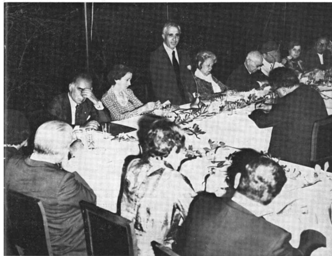
Il saluto del Presidente del Club Palermo Ovest