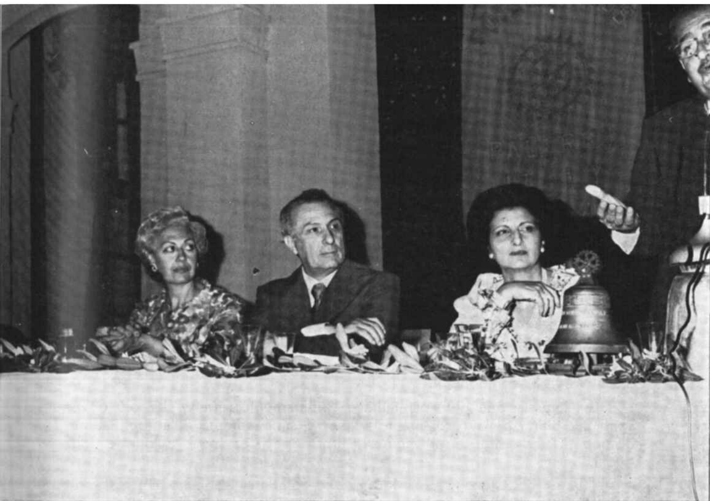
Il saluto alle Autorità