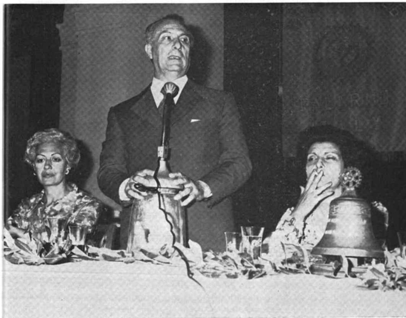
Il saluto del Dott. Marchello, Sindaco di Palermo