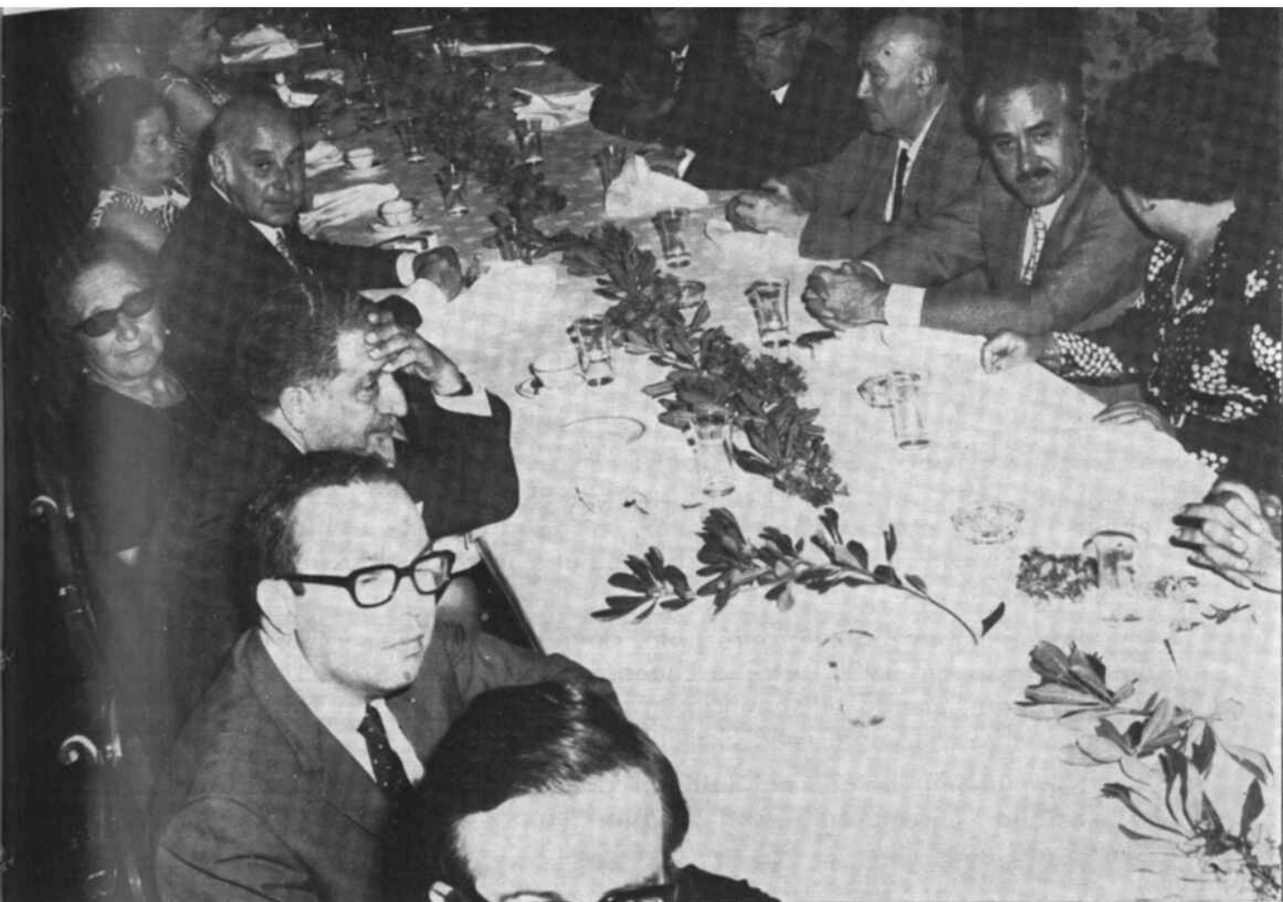
Altro lato della tavola