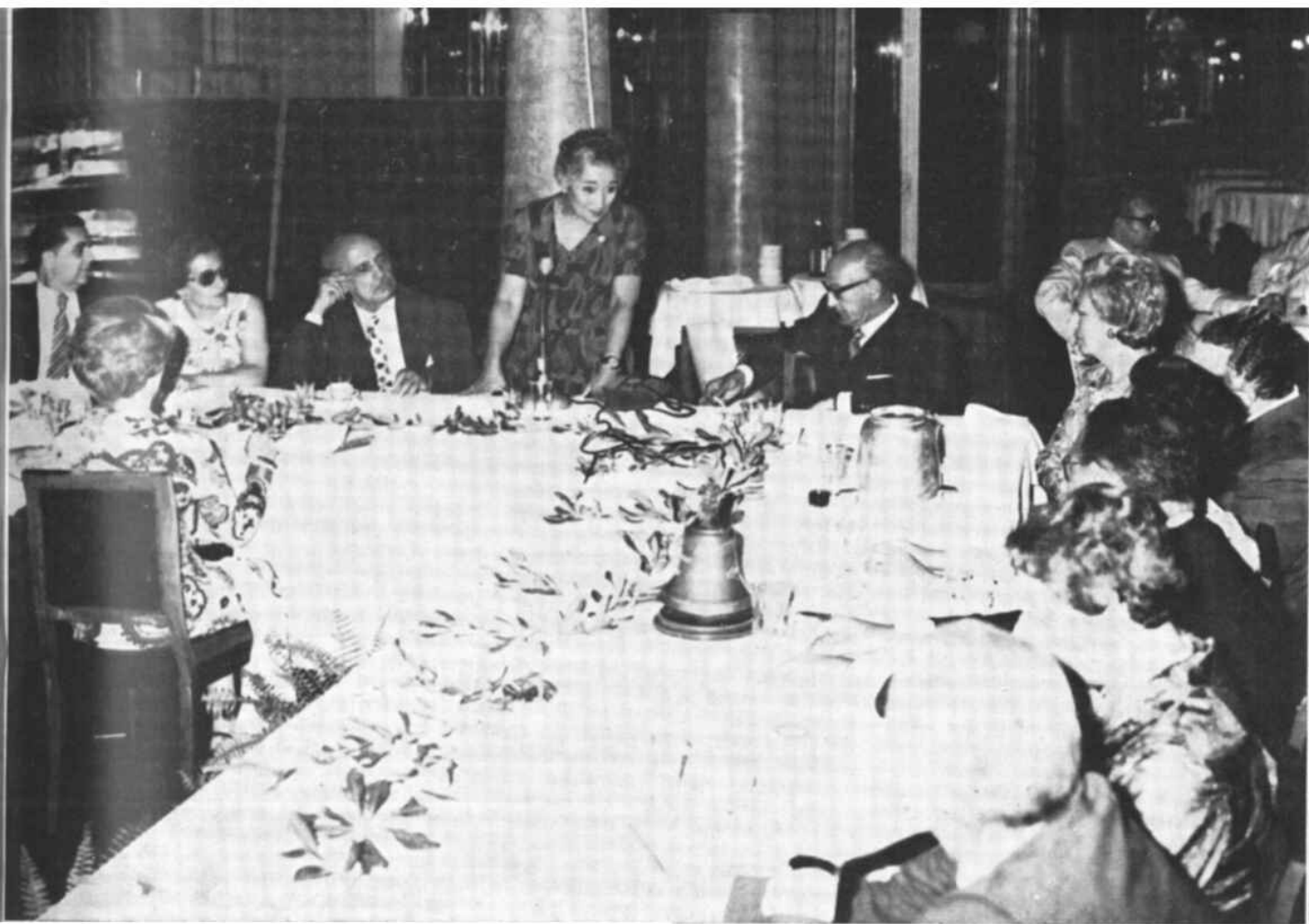
Il saluto della Presidente del Soroptimist Club