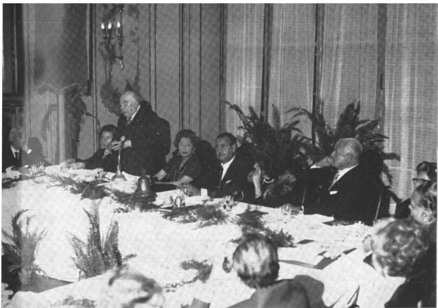
Il centro della tavola