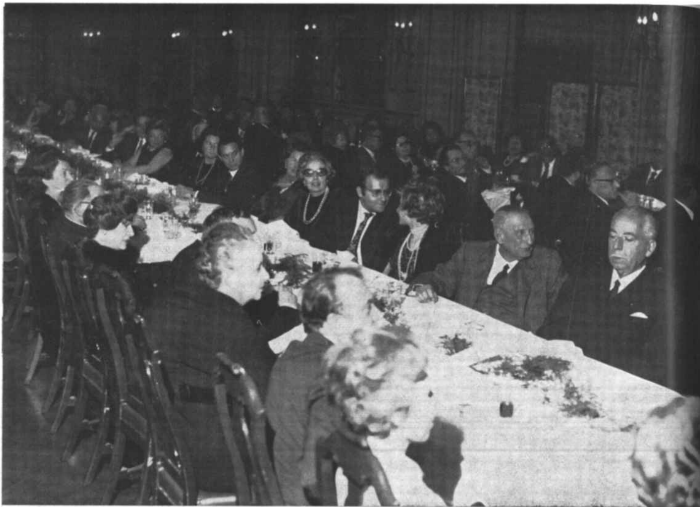
Uno spettacolo d'insieme