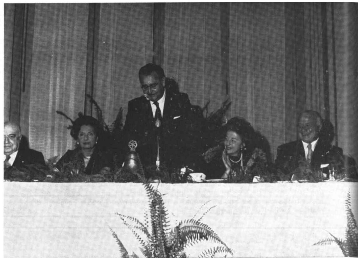
Il Presidente rivolge il suo saluto agli ospiti graditissimi