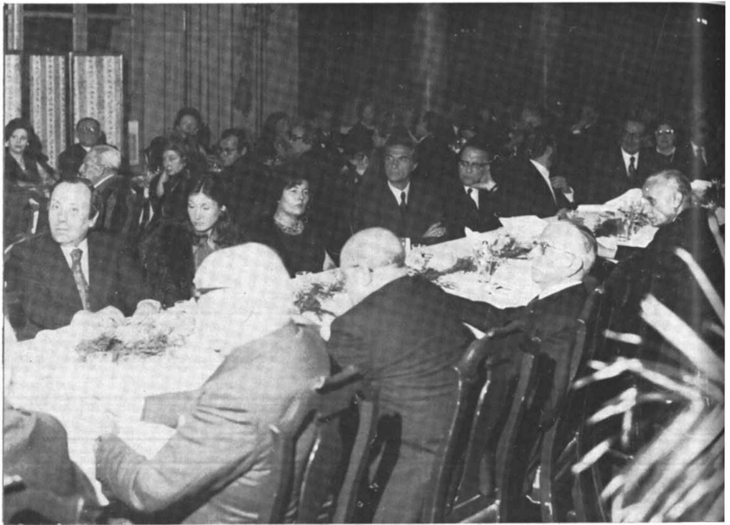
L'altro lato della tavola