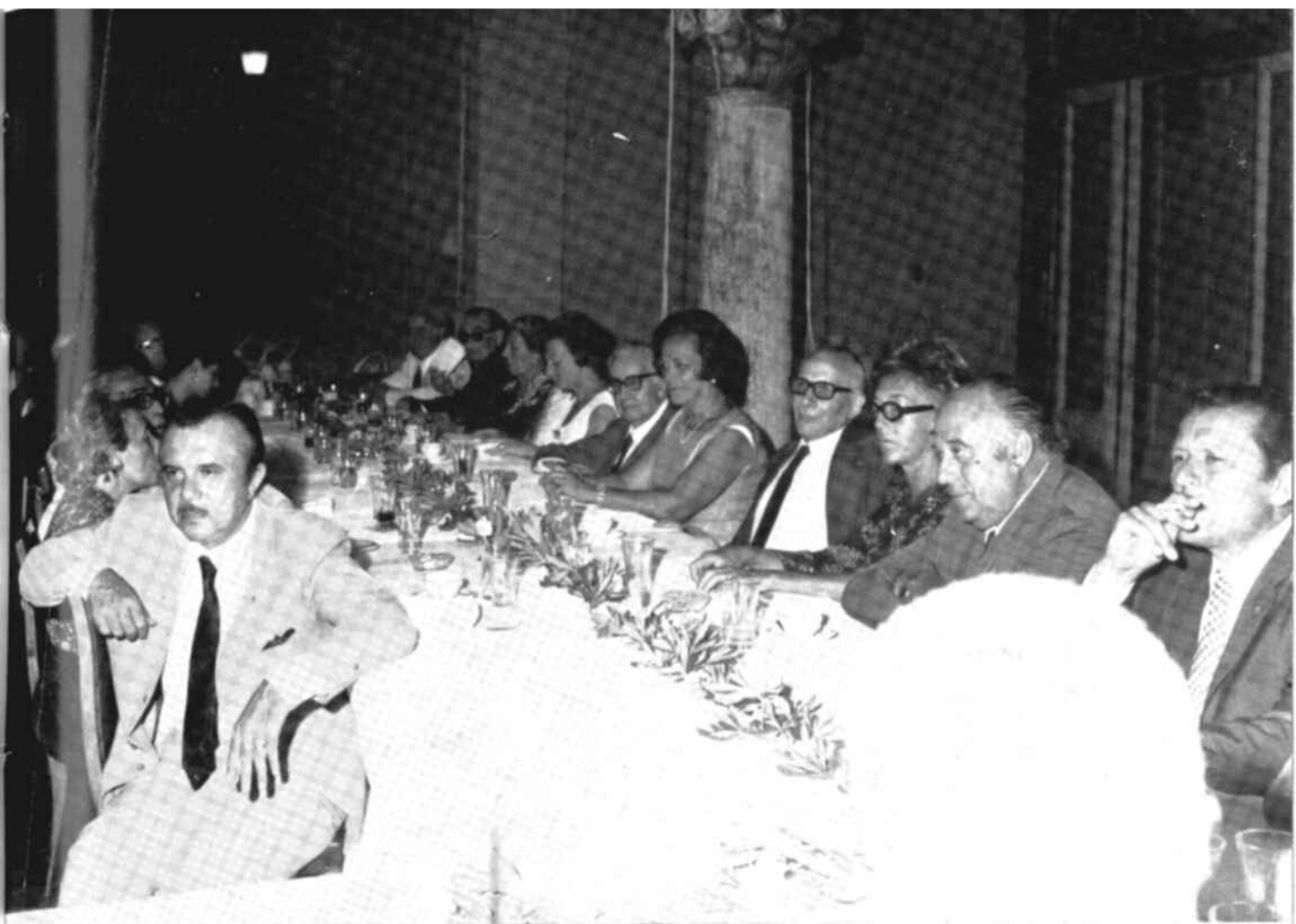
Uno scorcio della tavola alla seduta del 12 agosto 1971