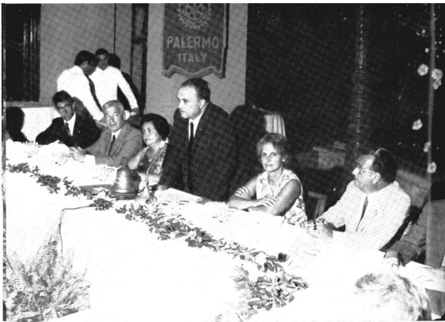
L'intervento del Prof. Tusa