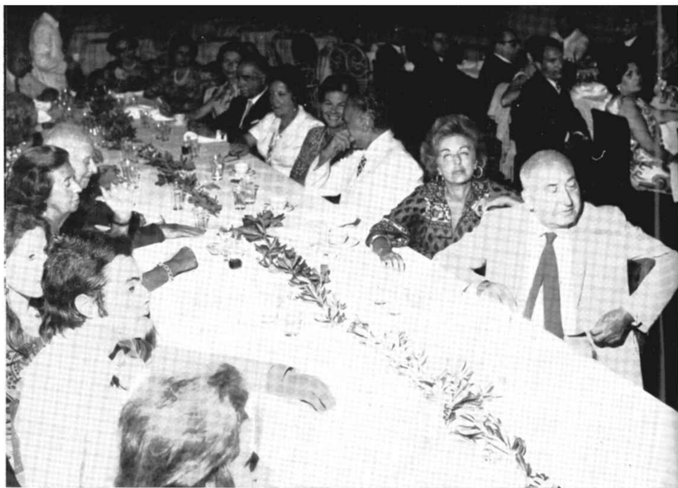
Un gruppo di invitati e di rotariani alla seduta del 12 agosto 1971