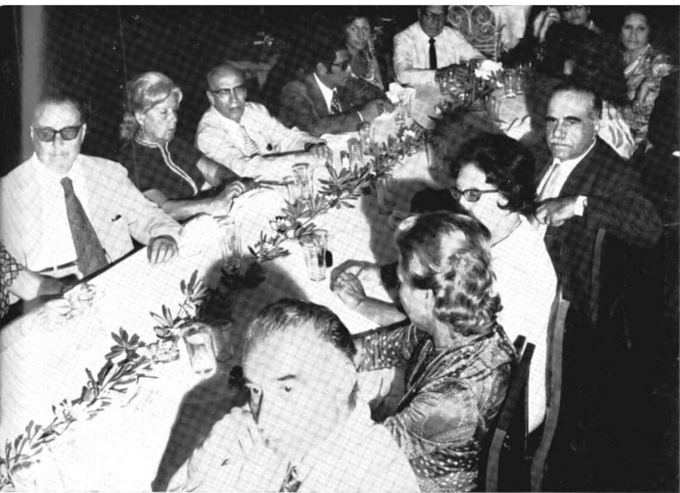
Altro gruppo di invitati e di rotariani alla seduta del 12 agosto 1971