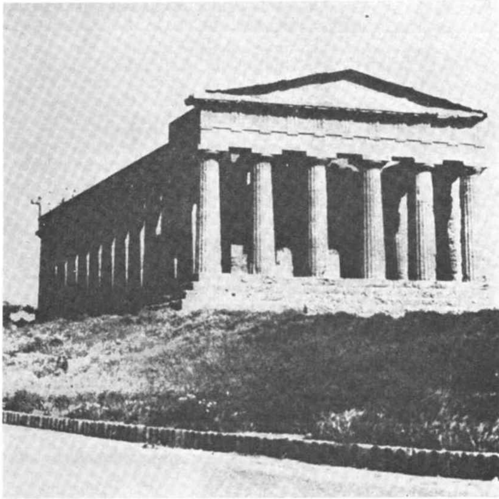
Il Tempio della Concordia di Agrigento